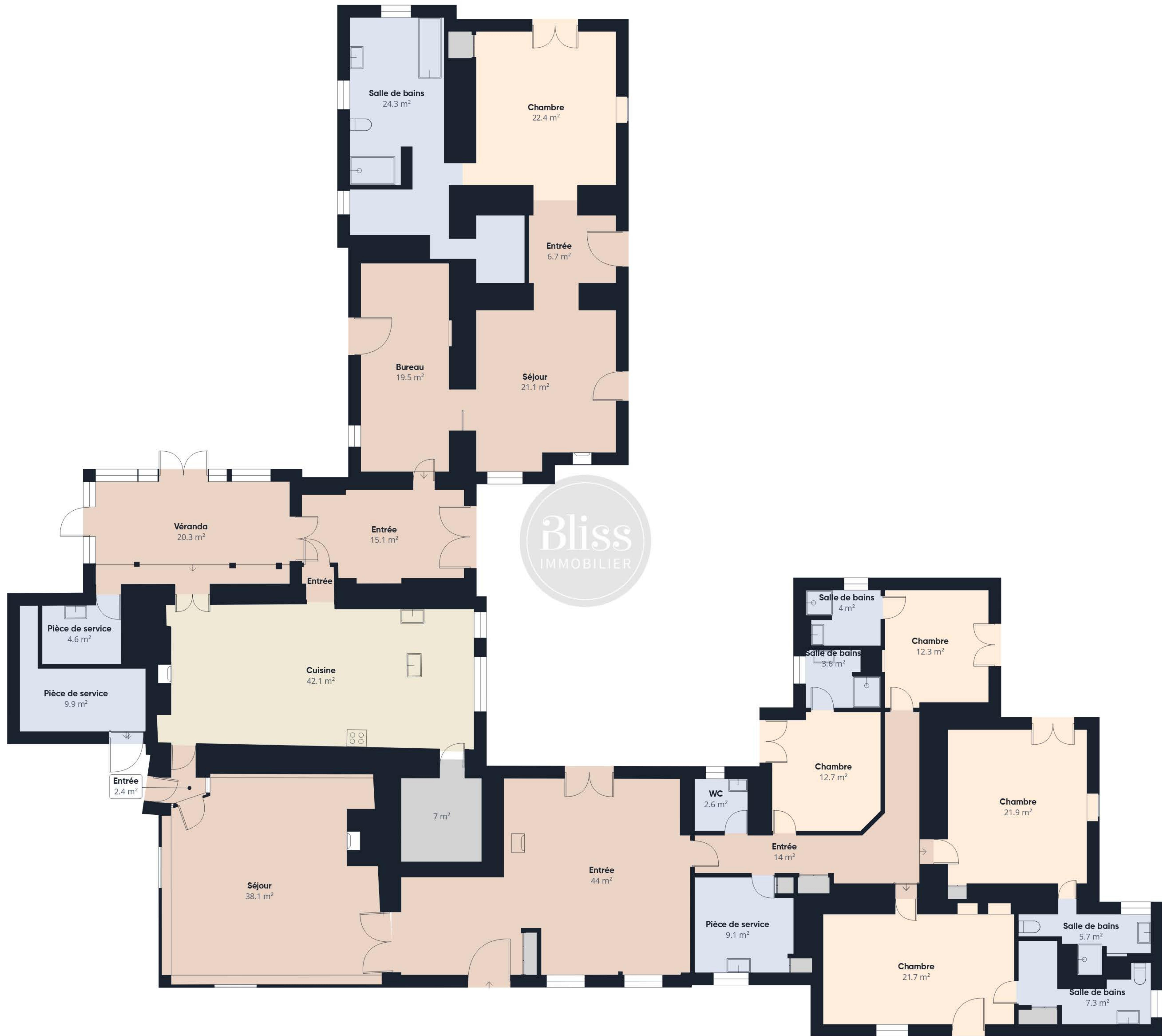
Niveau 0 Bâtiment 1